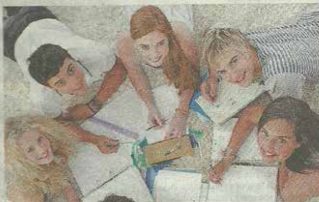
Ragazzi del Centro di aggregazione giovanile Podresca